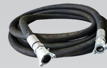
Tuyaux air comprimé