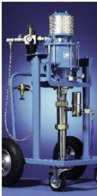
Pompe avec chariot élévateur

PROFESSIONAL – haute performance à moindre coûts