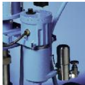
Le réchauffeur chauffe les produits constamment et rapidement.