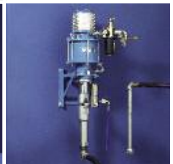
avec chariot élévateur (image à gauche) avec support mural (image en haut)