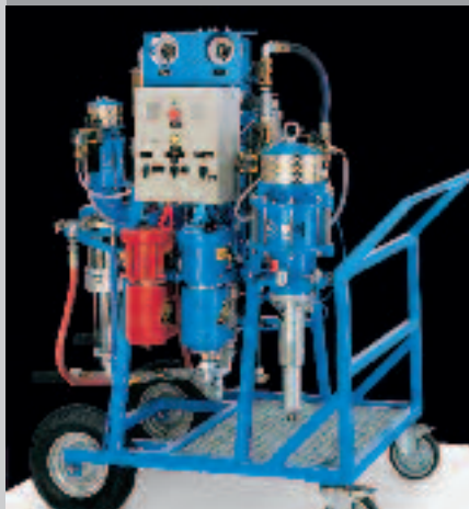
WIWA DUOMIX Unité de pulvérisation multi-composants