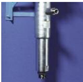
Grâce à un montage spécifique l'assemblage et désassemblage du moteur et du bas de pompe sont simples et précis.