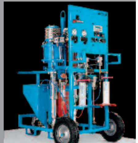
WIWA FLEXIMIX Dosage électronique