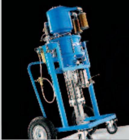
WIWA Equipements de pulvérisation Airless