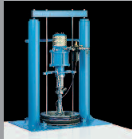
WIWA Plateaux Pousseur