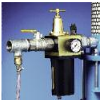
L'unité de maintenance est installée sur l'équipement.