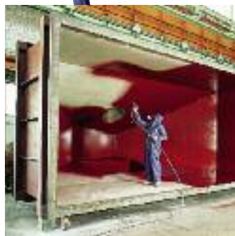
Dans la construction métallique on demande une haute performance et une bonne maniabilité.