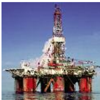
La protection anticorrosion des constructions offshores requiert une technologie robuste.