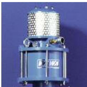
Une adaptation simple du rapport de pression grâce à l'échange du piston et du cylindre.