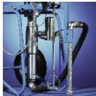
L'agitateur et le système d'aspiration sont installés exactement d'après les demandes individuelles.

L'assurance est la performance déjà mentionnée, la mise en service facile et la longévité de renommée mondiale.