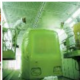
En tant que pompe d'alimentation pour plusieurs pistolets de pulvérisation la pompe WIWA PROFESSIONAL prouve sa force sur des chaînes d'application spécifiques.