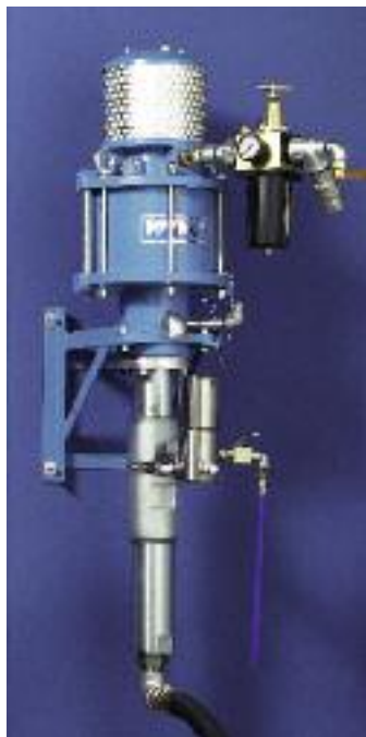
Pompe avec support mural