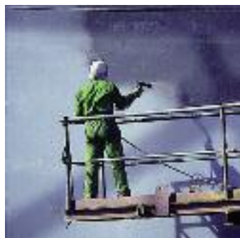
La couverture de grande superficie fournie par des pompes WIWA PROFESSIONAL satisfait les demandes de la construction maritime. Des hauts rapports pression évitent la perte de charge sur des longues distances de tuyaux.