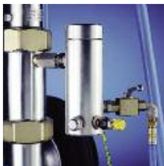
Filtre haute pression situé à la sortie de la pompe