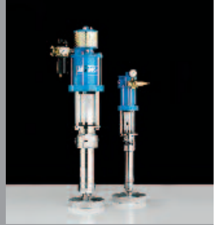
WIWA Pompes de transfert des fluides